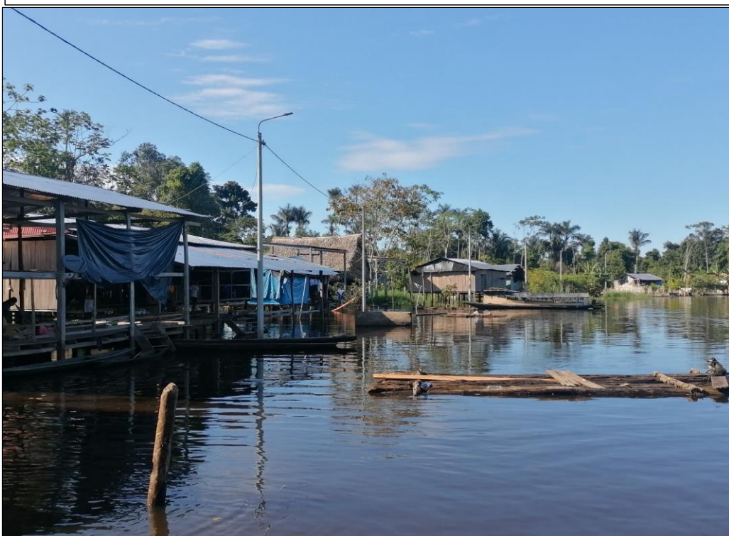
FIGURA N°03: EN EL TRAMO DE INTERVENCIÓN, LA RIBERA DE LA MARGEN IZQUIERDA DEL RÍO CHAMBIRA , LA RIBERA SE ENCUENTRA MUY DEBILITADO, ESTO A CONSECUENCIA DE LAS VELOCIDADES EROSIVAS DE LA CORRIENTE.