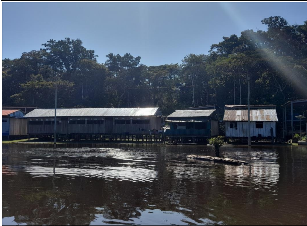
FIGURA N°01: TRAMO CRÍTICO EN EL RÍO CHAMBIRA EN EL SECTOR COMUNIDAD NATIVA NUEVO PROGRESO, DISTRITO URARINAS, PROVINCIA DE LORETO, DEPARTAMENTO DE LORETO.