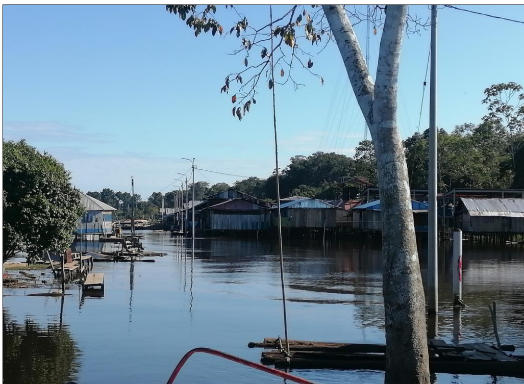
FIGURA N°02: ALGUNAS VIVIENDAS DE LA COMUNIDAD NATIVA NUEVO PROGRESO SE ENCUENTRAN EXPUESTOS ANTE EL INCREMENTO DEL NIVEL DE AGUA DEL RÍO.